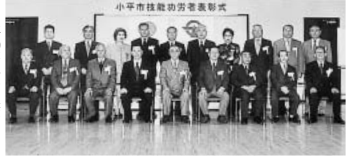
小平市技能功労者表彰式

市の産業振興に貢献した技能功労者の表彰式が、11月22日に市役所で行われました。