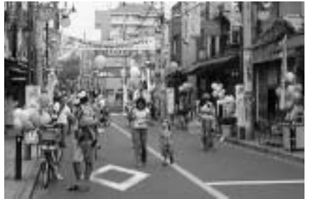
課題を抽出しました。

また、素案には小平市らしさが無いといったご意見もいただきました。さらに、公募による市民や商業関係者、学識経験者、消費者団体の代表者で構成される計画検討委員会を設け、素案をたたき合っており、いただいたご意見も含めて検討していただき、さらに表現などに一部修正を加え「小平市商業振興基本計画」として策定したものです。