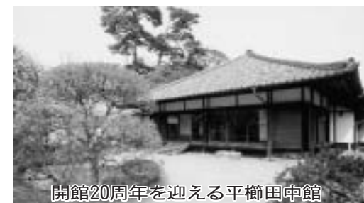
開館20周年を迎える平櫛田中館

一方、生活に目を向けます。犯罪の低年齢化や凶悪化による治安への不安や不況による雇用不安、年金