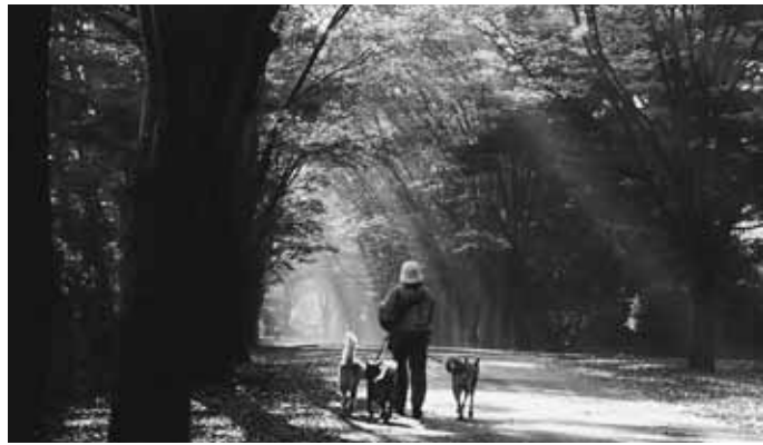
第10回金賞作品「早朝の小平霊園」