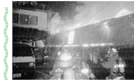
昨年市内の火災は88件で、火災による死者は4人でした。火災の発生をいち早く発見するため、小平消防署では住宅用火災警報器設置キャンペーンを行います。