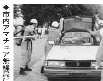
◆市内アマチュア無線局にご協力

訓練の内容 ◆体験訓練 会場では、震度を体感できる起震車、消火器による初期消火訓練、応急救護訓練、煙体験ハウス、ロープワーク体験、バケツリレー、炊き出し訓練などの体験ができます。