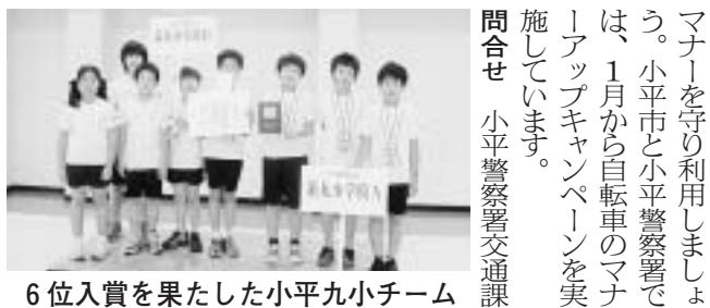
6位入賞を果たした小平九小チーム