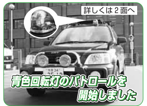
青色回転灯のパトロールを開始しました

◇小平市ホームページ http://www.city.kodaira.tokyo.jp ◇電子メール info@city.kodaira.tokyo.jp