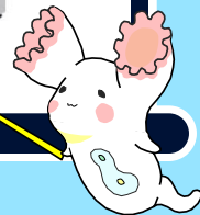
微生物キャラクター ヒルガタワムちゃん