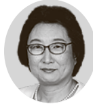
津本裕子議員 (市議会公明党)