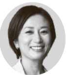
川里富美議員 (フォーラム小平)