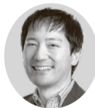
山田大輔議員 (政和会)