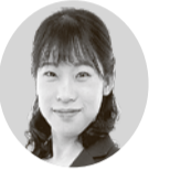
石津はるか議員 (政和会)