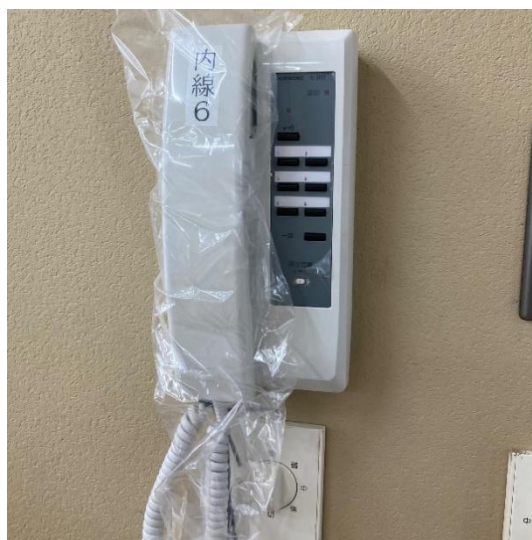
職員室と各教室等を繋ぐインターホンを設置