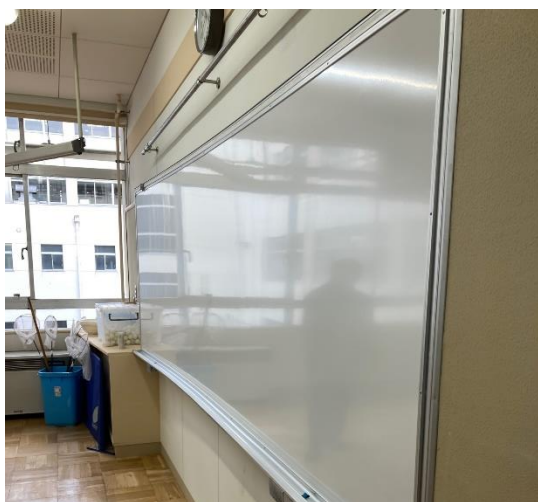
ホワイトボードを設置