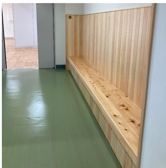
多摩産材のベンチを設置