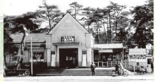
商大予科前駅は昭和8年に開業し、昭和24年に一橋大学駅に改称しました。