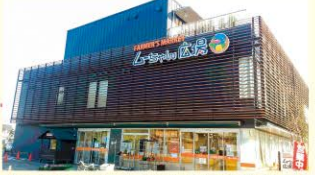
平成28年から新店舗で営業しています。市内の新鮮農産物や植木などを購入することができます。