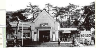
商大予科前駅は昭和8年に開業し、昭和24年に一橋大学駅に改称しました。

百七歳の長寿で知られる近代彫刻の巨匠・平櫛田中の終えんの館を保存・公開する美術館。(現在は部分公開) 開館時間 10時～16時 休館日 毎週火曜日(休・祝日の場合はその直近の平日) 12月27日～1月5日 入館料 一般300円 小中学生150円 ※団体割引あり