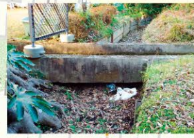
上を流れるのが鈴木用水で、下を流れるのが田無用水です。

※サルートを歩いた場合、距離約6.9km、時間約1時間44分、消費カロリー312kcal、歩数約9857歩