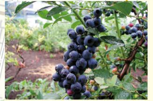
ブルーベリー栽培発祥の農園ブルーベリーが日本で初めて農産物として栽培されたのが小平市です。市内にはブルーベリーの直売所、摘み取り農園などを扱うお店がたくさんあります。