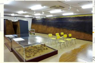
約3万8千~1万6千年前の旧石器時代等を中心とする遺物が展示されている施設です。鈴木遺跡は昭和49年、鈴木小学校建設の際に発見され、令和3年3月に国史跡に指定されました。水・土・日・休祝日が開館日です。開館時間10時~16時。