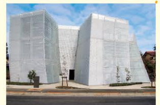
なかまちテラスは、「人と情報の出会いの場」をコンセプトに建築された公民館と図書館の複合施設です。