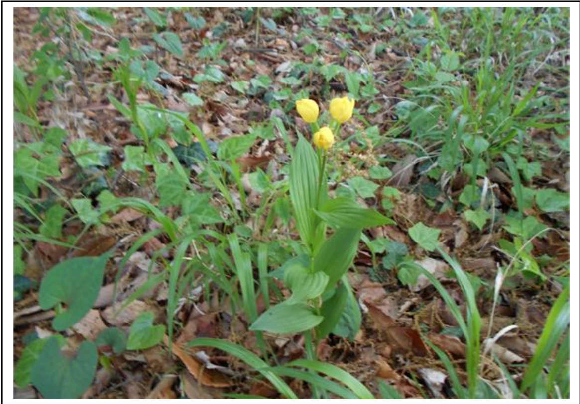
小川町1丁目特別緑地保全地区のキンラン