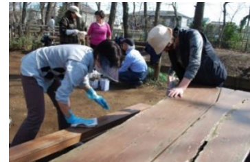
活動するアダプト団体

市民によるみどりの保全活動の推進、市民のみどりについての理解の向上が期待できます。