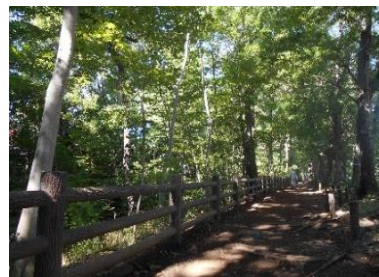
小平グリーンロード

みどりの適切な管理・更新を行い、小平市全体の水と緑のネットワークの形成を推進することで、小平市を代表するみどりとして、市内外から多くの利用者の増加が見込めるほか、野生生物の生息空間が確保され、生物多様性の保全にもつながります。