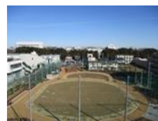
リサイクルセンター広場

施設利用者がみどりにふれる機会が増えることや、市が率先して公共施設の緑化に取り組むことで、事業者等への緑化の取組の拡大が期待できます。