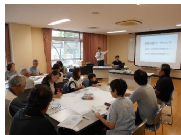
鎌倉公園ワークショップ

都市計画公園を整備することで、良好な都市環境が形成され、公園の活用機会が増加するほか、オープンスペース等の確保による防災面の強化などが期待できます。