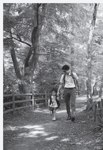
「表紙の作品について」