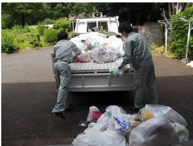
写真1-1 ごみの搬入作業