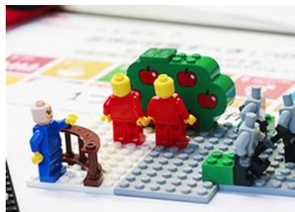
LEGOを使ったワークショップの様子