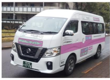
ぶるペー号(9人乗りワンボックスカー)

※9時～12時台、16時～17時台は、⑭に停車しません。 13時～15時台は、④、⑤、⑫は停車しません。