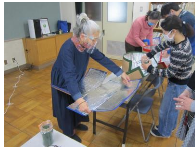
おひさまクッキングの様子