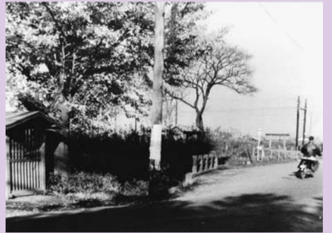
青梅橋の写真(1952年頃)

ることを決め、翌年小川村とそのほか6つの村が一つになり、小平村ができました。この時、野火止用水より北西側にも村はありましたが、それらは小平村とはいっしょにならなかったため、小平村の北西側の境は野火止用水に沿ったものとなりました。このときの小平村の範囲が、今の小平市の範囲になりました。