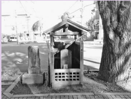
図2 青梅橋交差点の庚申塔

ることを決め、翌年小川村とそのほか6つの村が一つになり、小平村ができました。この時、野火止用水より北西側にも村はありましたが、それらは小平村とはいっしょにならなかったため、小平村の北西側の境は野火止用水に沿ったものとなりました。このときの小平村の範囲が、今の小平市の範囲になりました。