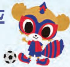
チームマスコット 「東京ドロンパ」

小平市大沼町にはサッカーJ1に所属するプロサッカーチームFC東京の練習場があり、ホームタウンとしてFC東京と連携し、さまざまな事業を展開しています。小平市はFC東京を応援しています!ぜひ、一緒にFC東京を応援しましょう!