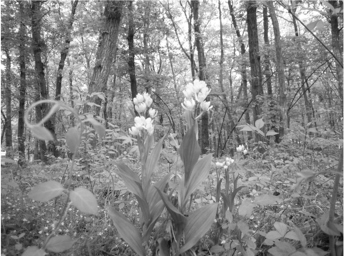
(雑木林に生息するキンラン)