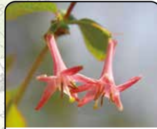
ウグイスカグラ (花: 2~4月)