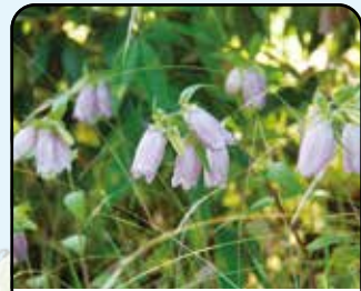
ホタルブクロ (花: 5~7月)