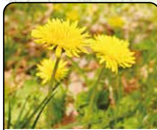
カントウタンポポ (花: 3~5月)