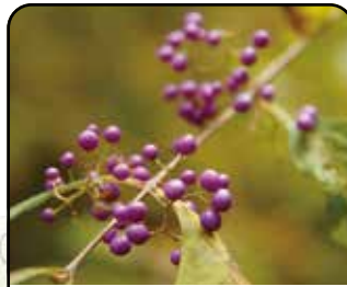
ムラサキシキブ (実: 10~11月)