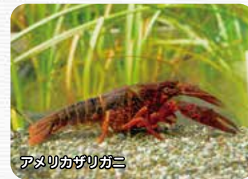
アメリカザリガニ