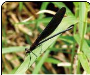
ハグロトンボ (成虫)