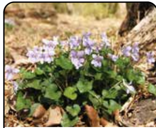
タチツボスミレ (花: 3~5月)