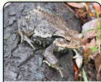
アズマヒキガエル