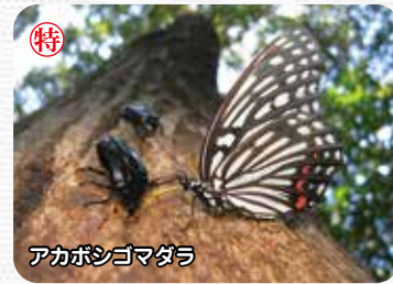
アカボシゴマダラ