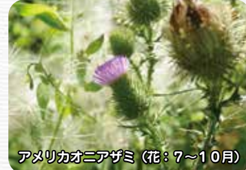
アメリカオニアザミ (花: 7~10月)

特 特定外来生物：生態系に与える影響が大きいため「外来生物法」により飼育や移動などが禁止されている外来種