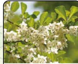
エゴノキ (花: 5~6月)