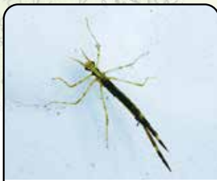
ハグロトンボ (ヤゴ)