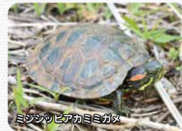
ミシシッピアカミミガメ