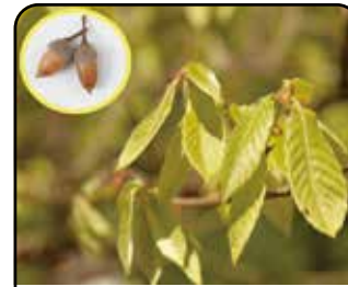
コナラ (花: 3~4月)