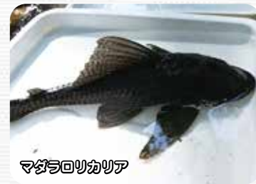
マダラロリカリヤ