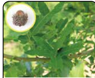
クヌギ (花: 3~4月)