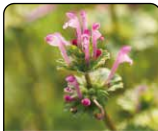
ホトケノザ (花: 3~6月)