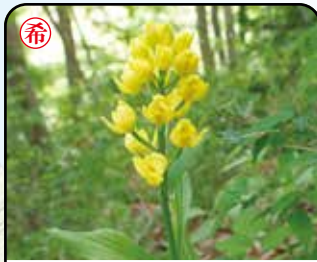
キンラン (花: 4~5月)