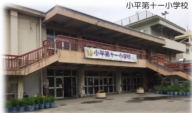
小平第十一小学校

学校の建て替えでは、教育活動の充実、教育環境の向上を図るとともに、小学校へ地域学習・コミュニティ機能を複合化することにより、“小学校を地域の核”とした地域コミュニティの醸成を図っていくことを目指し、取組みを進めています。