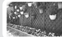
花壇の整備などの環境支援