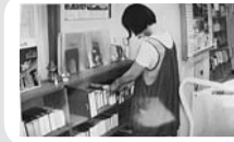
読み聞かせや図書室の整備などの図書活動支援