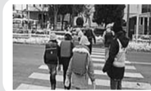
登下校や社会科見学・遠足などの見守り支援