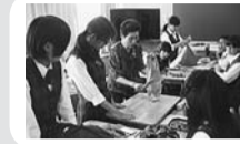
授業のアシスタント、実技の補助などの学習支援