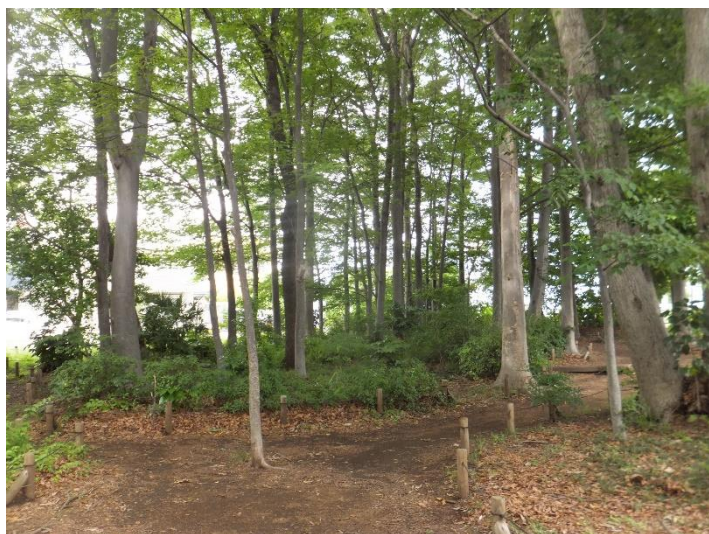
（下草刈り後の様子）