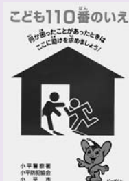
「こども110番のいえ」プレート