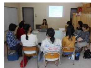
↑講師をお招きして保護者勉強会を行うこともあります。