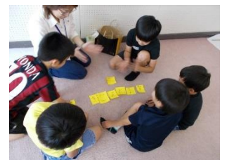
↑吃音グループ活動の様子

(令和3年度 年度末現在) ※年度途中の入級・卒級に伴い通級児童数は変動します。