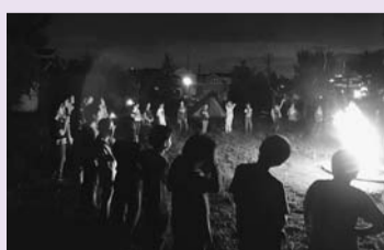
(みんなで楽しく野外活動!)

青少年委員が企画・運営するこの講座は、年間を通じて開催され、野外活動やレクリエーション、郷土学習などを通して、地域で活躍する「青少年リーダー」を育てることを目的としています。