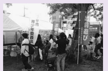
(一昨年度の市民まつりの様子)