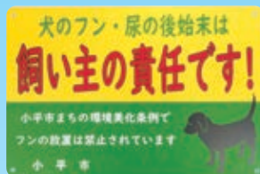
犬フン持ち帰り啓発看板