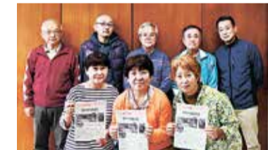
たかの台自治会の皆さん

自治会に入ると回覧板などを通して、地域のことを知ることができます。また、日頃から顔が見える関係になり、何か困ったときにも助け合うことができます。役員になる回数を少なくするなど、負担のないよう工夫をしています。今後も、安心・安全でよりよいまちを目指して、活動していきたいと思っています。