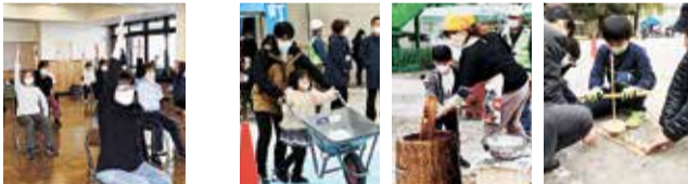
ストレッチ体操教室(学園東町自治会) 回田秋まつり(回田町会)