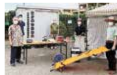
災害時に備えた防災倉庫

たかの台自治会では、都や市の補助金などを利用し、消火器の設置や、トイレントなどの災害用品の備蓄、防犯灯の設置など、災害・防犯対策に取り組んでいます。また、チラシやホームページで活動内容をお知らせしています。何かあったときに、みんなで助け合っていけるよう活動しています。