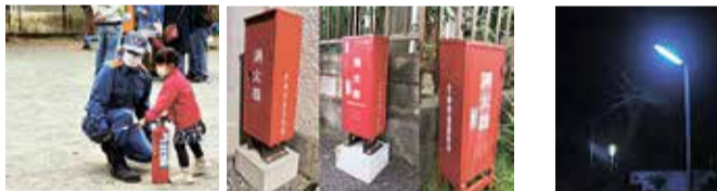
防災訓練(回田町会) 消火器(たかの台自治会) 防犯灯(たかの台自治会)