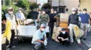
ごみ拾い(よしの自治会)