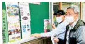
掲示板への掲示(学園東町自治会)