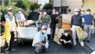
ごみ拾い(よしの自治会)