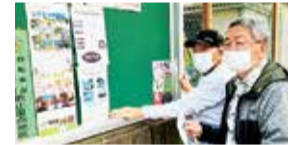
掲示板への掲示(学園東町自治会)