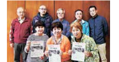
たかの台自治会の皆さん

自治会に入ると回覧板などを通して、地域のことを知ることができます。また、日頃から顔が見える関係になり、何か困ったときにも助け合うことができます。役員になる回数を少なくするなど、負担のないよう工夫をしています。今後も、安心・安全でよりよいまちを目指して、活動していきたいと思っています。