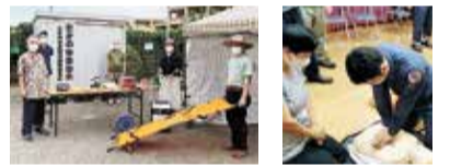
災害時に備えた防災倉庫 救急法講習会

たかの台自治会では、都や市の補助金などを利用し、消火器の設置や、トイレントなどの災害用品の備蓄、防犯灯の設置など、災害・防犯対策に取り組んでいます。また、チラシやホームページで活動内容をお知らせしています。何かあったときに、みんなで助け合っていけるよう活動しています。