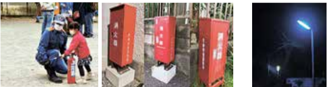
防災訓練(回田町会) 消火器(たかの台自治会) 防犯灯(たかの台自治会)