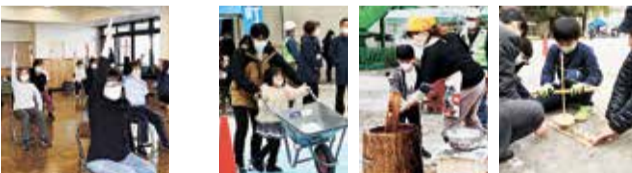
ストレッチ体操教室(学園東町自治会) 回田秋まつり(回田町会)