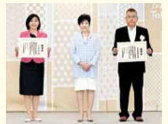
左から、小平市長、東京都知事、小平交通安全協会会長