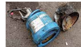
火災の原因となった ガスカートリッジ缶

ガスカートリッジ缶とスプレー缶、ライターは使い切ってから、缶とライターに分け、透明か半透明の袋に入れて有害性資源の日に出してください。使い切ることができない場合は、お問い合わせください。