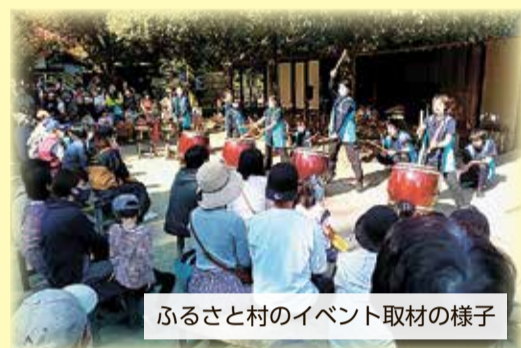
ふるさと村のイベント取材の様子