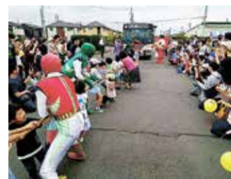
バスとタクシーのひろば