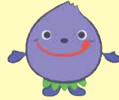
小平市シンボルキャラクター ふるべー