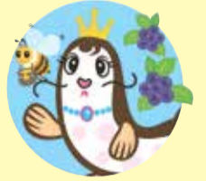
TOKYO854くるめら 公式キャラクター くるめらちゃん