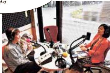
本番では、小学生と同じクイズを出題