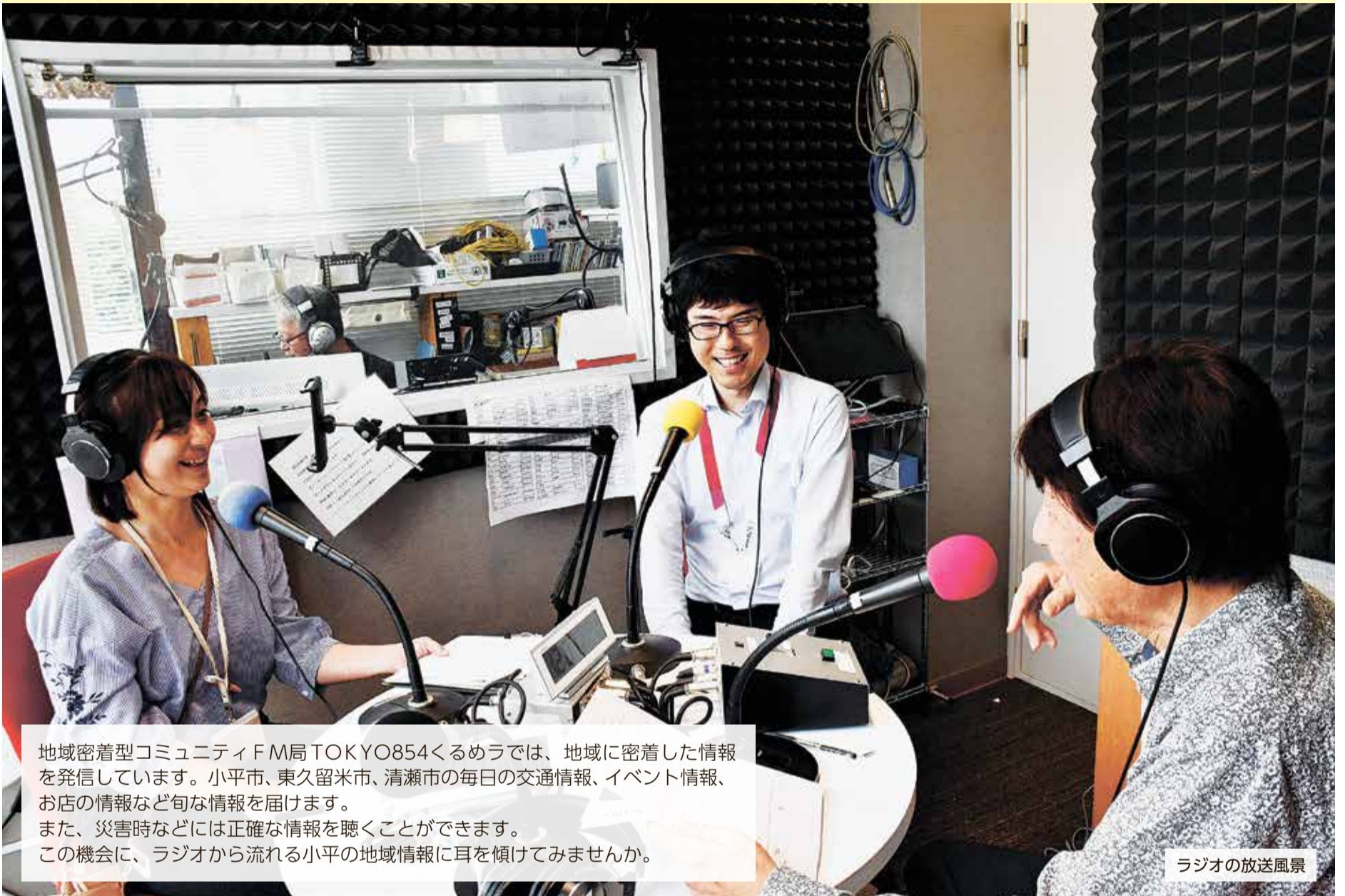
ラジオの放送風景

地域密着型コミュニティFM局 TOKYO854くるめらでは、地域に密着した情報を発信しています。小平市、東久留米市、清瀬市の毎日の交通情報、イベント情報、お店の情報など旬な情報を届けます。 また、災害時などには正確な情報を聴くことができます。 この機会に、ラジオから流れる小平の地域情報に耳を傾けてみませんか。