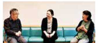
小平市聴力障害者協会の皆さん

手話がいつでも、どこでも、誰とでもつながることができる環境やきっかけになればいいな、と思っています。