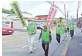
防犯パトロール (上水本町旭ヶ丘自治会)