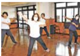
ストレッチ体操教室 (学園東町自治会)