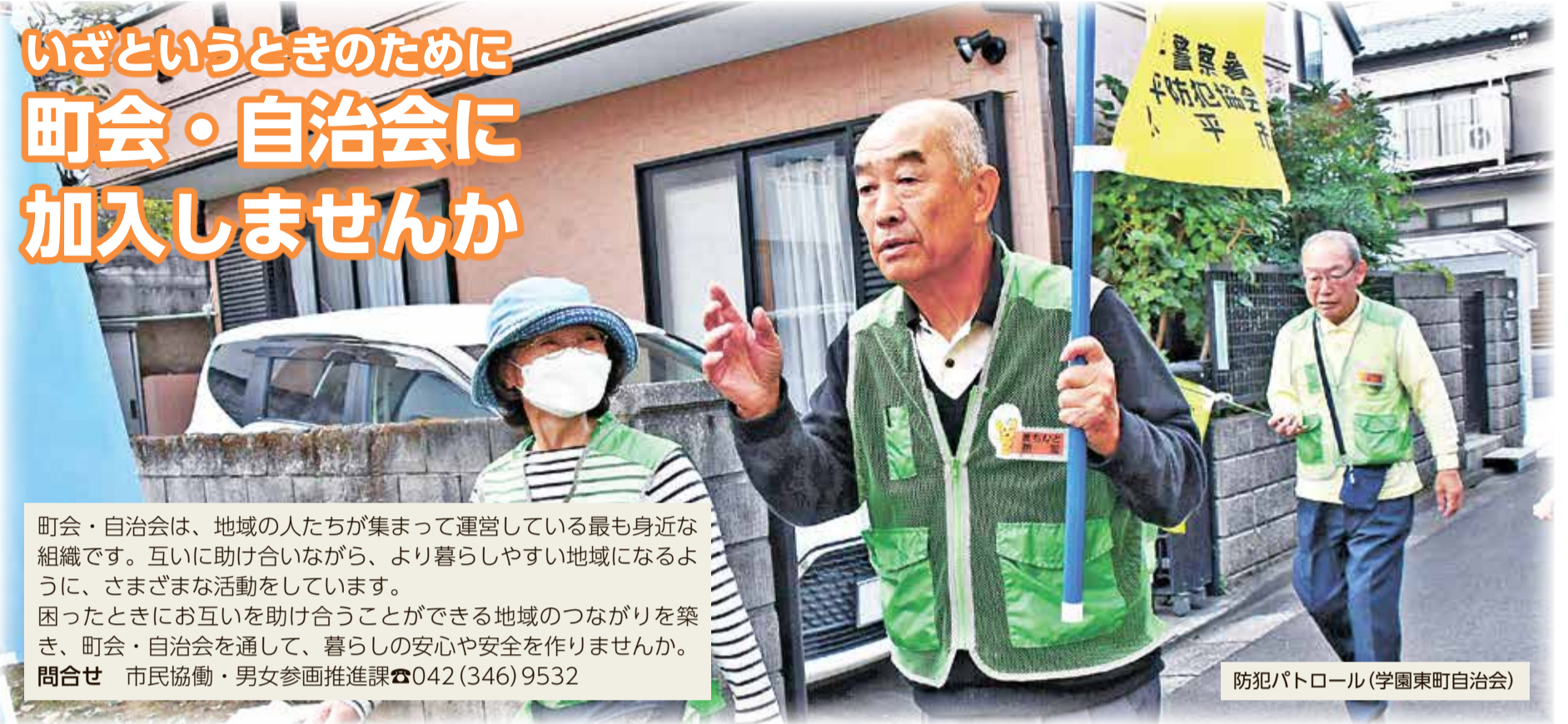
防犯パトロール(学園東町自治会)

町会・自治会は、地域の人たちが集まって運営している最も身近な組織です。互いに助け合いながら、より暮らしやすい地域になるように、さまざまな活動をしています。 困ったときにお互いを助け合うことができる地域のつながりを築き、町会・自治会を通して、暮らしの安心や安全を作りませんか。 問合せ 市民協働・男女参画推進課 ☎042(346)9532