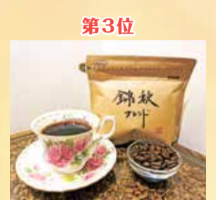
第3位 錦秋ブレンド (永田珈琲倶楽部)