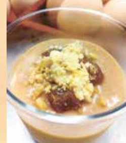
小平づくしの栗うこっけいプリン (パティスリーかしの木)