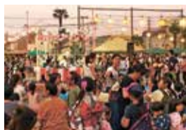
納涼盆踊り (花南地区の自治会員の方々)