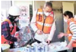
防災フェスタ (富士見住宅自治会)