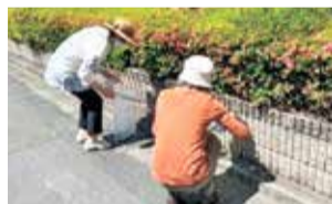
地域のごみ拾い (虹が丘第一自治会)