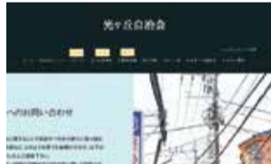
自治会のホームページ (光ヶ丘自治会)