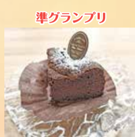
準グランプリ 小平ブルーベリーガトーショコラ (ガトーショコラ専門店 donna café)