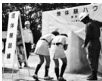
この機会に、地震があった

◆市内アマチュア無線局にご協力 小平市アマチュア無線クラブでは、訓練会場で無線局(JE1YKR)を開設します。市内各局からのコールをお待ちしています。周波数は、430MHz F M帯を使用します。 ◆会場の近くにお住まいの方へ