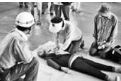
この機会に、身の回りの災害について考え、災害時に適切な行動ができるように、家族そろって参加しましょう。

たしたちが守る」を防災の基本理念とし、市民や防災関係機関が一体となり、防災行動力を高めることを目的に行います。