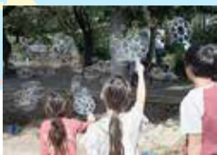
令和7年度 遊び場イベントの様子

学生・若者でチームを結成し、こどもたちが交流できる遊び活動を企画、運営する取り組みを始めています。