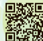
スマートフォン用アプリ 申込みフォーム