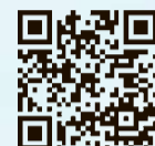
活動量計 申込みフォーム