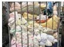
集められたふとん