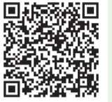
カタログポケット QRコード