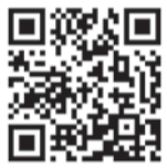
小平市ホームページ QRコード