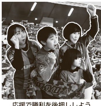
応援で勝利を後押ししよう

内容 明治安田生命グループ第9館松本山雅FC戦のホーム自由席での観戦 申込み 4月10日(水)の午後11時までに、右下のQRコードを読み取って申込み専用ページ(https://www.members-league.jp/members/auth/index/7/0/20158)