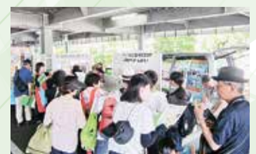
イベントへの出展