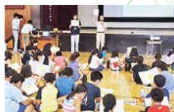
小学校への出前授業