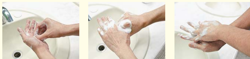
指先・爪を手のひらでこすります 親指をねじるように洗います 手の甲と指の間をこすります