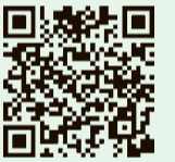
学校体育館スポーツ個人開放中止日

5月31日(日)まで全校で開放を中止します。 6月以降の予定は、小平市ホームページ（右図QRコードからアクセス）をご覧ください。 問合せ 文化スポーツ課 ☎042(346)9612