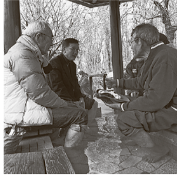
こもれびの足湯で意見交換

市民活動、その他 ◆10月27日(日) 小平元気村おがわ東（元気村まつり会場内） ▽小川駅の再開発や中央公民館の更新で、施設使用料の見直しがあると聞くが、利用料金の免除制度を続けてほしい ▽障がい者がスポーツをしやすいう、体育館の施設使用料を高齢者と同じくらいに割引してほしい。指導員がつくとなお良い