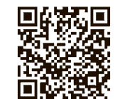
東京都 新型コロナウイルス 感染症支援情報ナビ