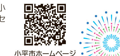
小平市ホームページ