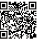
小平市アプリの紹介QRコード