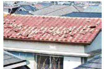
地震による屋根瓦の破損

震災後、道を歩くときは上からの落下物や地面のひび割れなどに注意が必要です。避難所までの経路で、危険な場所の確認をしましょう。また、落下物から身を守るためのヘルメットや、歩きやすい靴など、震災後に外を歩くときに身を守るための備えもしましょう。