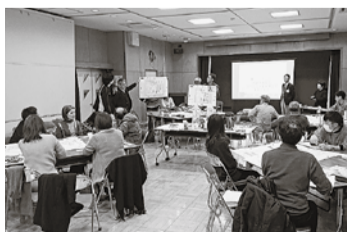
過去に実施したワークショップの様子

※申込書は市内の公共施設にあるほか、小平市ホームページからダウンロードもできます。