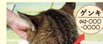
家から逃げ出してしまったときのために名札をつけておきましょう

飼い主は、動物の習性や生理をよく理解し、最後まで愛情を持って終生飼養する責任があります。動物愛護管理法で愛護動物の遺棄や虐待は禁止されています。