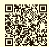
相談ほっとLINE @東京アカウント

無料通話アプリLINEを使って、つらいと感じていることや悩みなどの相談ができます。 と き 午後3時～10時 9時30分まで受付 ※右図のQRコードを読み取り、相談ほっとLINE@東京のラインアカウントを友だち登録してご相談ください。